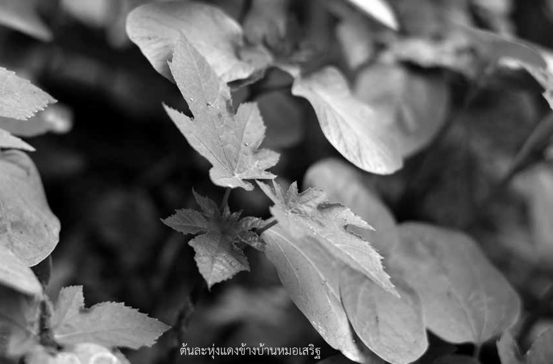
ต้นละหุ่งแดงข้างบ้านหมอเสริฐ