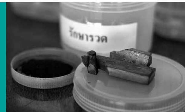
ยาสมนไพรรักษาโรคหรือปรวด