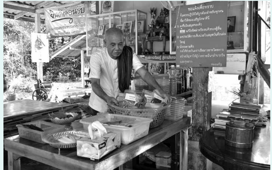
พ่อหมอเสิริฐจัดยาสมุนไพรไว้เป็นหมวดหมู่