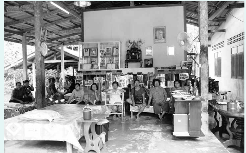
ชาวบ้านเจ็บป่วยมานั่งรอคิวการตรวจรักษาที่บ้านพ่อหมอเสรีฐ