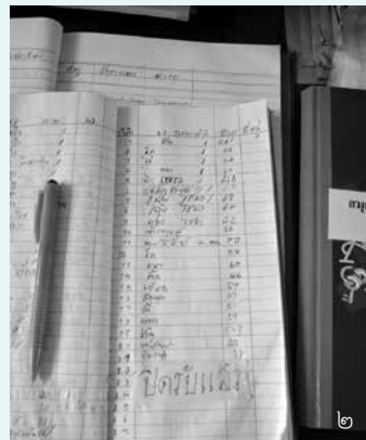
๑. การทดสอบโครงสร้างร่างกายผู้ป่วย ๒. สมุดบันทึกคิวผู้ป่วยยาวเหยียดในแต่ละวัน