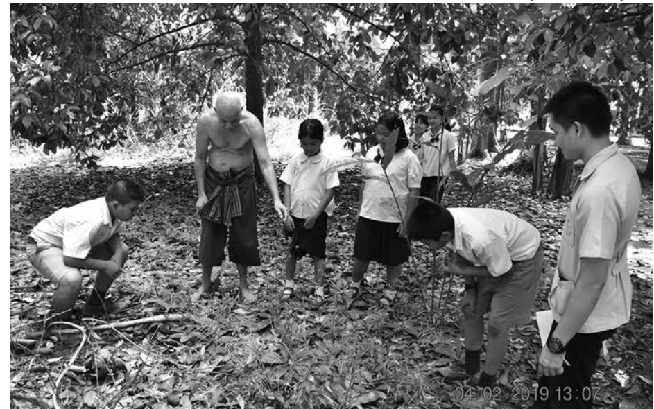
สอนนักเรียนโรงเรียนนพคุณรู้จักพืชสมุนไพรที่บ้าน