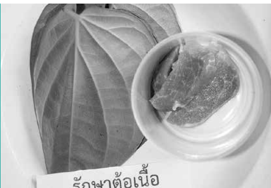
สิ่งของที่ใช้ในพิธีกรรมบำบัด เคล็ดการรักษาตาต้อด้วยคาถา