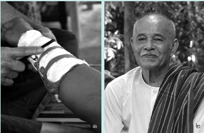
๑. การเข้าเผือกต่อกระดูก ๒. พ่อหมอเสิริฐในวัย ๘๒ ปี